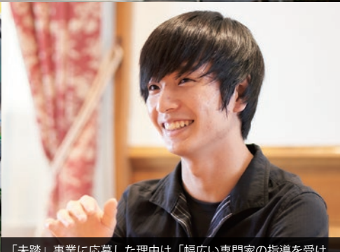
「未踏」事業に応募した理由は「幅広い専門家の指導を受けられるから」