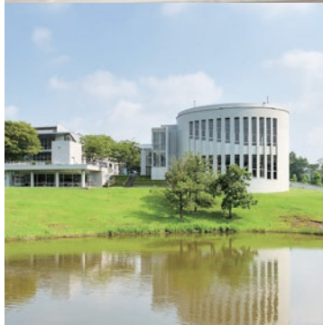
湘南藤沢キャンパス